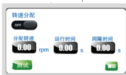
分配转速及间隔时间界面