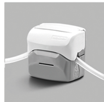
4. 向下合上泵头翻盖，完成软管安装。