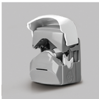
1. 向上掀开泵头翻盖，打开泵头。